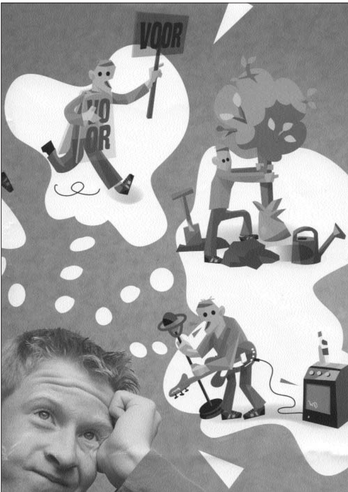
Poster Euro's 4 U, zie ook www.vlaardingenvlaanderen.nl/jongeren

Informatie: Winny Bogaards - wogaards@pjpartners.nl