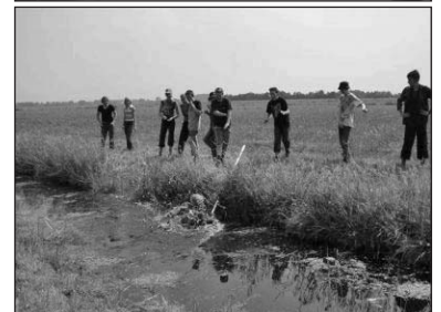
De foto's: boven publieksprijs, onder juryprijs