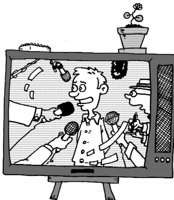
Illustratie: Lucas Sluys

Of zijn er grenzen aan datgene wat gezegd mag worden?